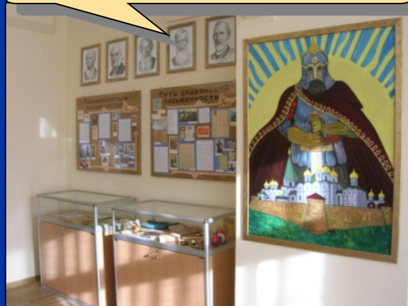
Музей Русского языка